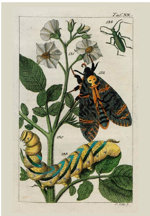
8. attēls. Neue Bilder Gallerie für junge Söhne und Töchter . Berlīne, 1796.

Ilustrācijas, īpaši krāsainas, piesaista uzmanību. Tajās pasauli var attēlot ļoti tuvu īstenībai jeb reālistiski. Ar šādu attēlu palīdzību cilvēkus var izglītot, iepazīstinot ar lietām, kuras tie iepriekš nav redzējuši vai kārtīgi izpētījuši.