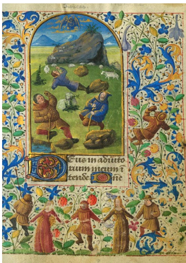
1. attēls. Horae Beatae Mariae Virginis . Francija, 15. gs. Latvijas Nacionālā bibliotēka.

Vissenākās grāmatās, kas saglabājušās Latvijas zemē, ir pilnībā gatavotas ar rokām. Senās grāmatas sauc par manuskriptiem . Latīņu valodā manu ir roka un skript nozīmē rakstīt.