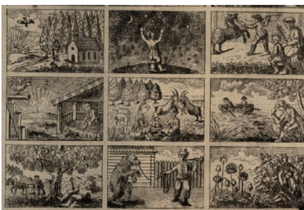
6. attēls. Gothards Frīdrihs Stenders. Bildu ābice. Jelgava, 1787.

Pirms nedaudz vairāk kā 200 gadiem mācītājs un skolotājs Gothards Frīdrihs Stenders, kuru dēvēja par Veco Stenderu, izveidoja pirmo tieši bērniem paredzēto ilustrēto grāmatu latviešu valodā. Šo grāmatu sauc par “Bildu ābici” (mūsdienās mēs teiktu – bilžu ābeci), un bērni no tās mācījās lasīt. Katram burtam Vecais Stenders sacerēja dzejolīti un uzzīmēja ilustrāciju. Visas ilustrācijas tika iespiestas uz vienas lapas, tās bija pēcāk jāizgriež, jāielīmē pie attiecīgā dzejoļa un jāizkrāso (6. attēls).