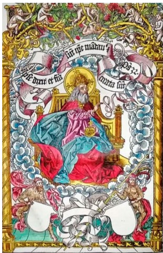
5. attēls. Hartmann Schedel. Liber chronicarum . Nirnberga, 1493.