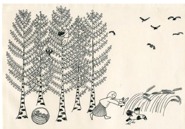
10. attēls. Jāņa Jaunsudrabiņa zīmējums “Dārtīte”, 1910–1914. Papīrs, tuša. 13,6 x 19,2 cm. Ilustrācija “Baltajai grāmatai”. Latvijas Nacionālā mākslas muzeja krājums.

6. Veic aptauju savā ģimenē, klasē vai draugu lokā. Pieraksti trīs bērnu grāmatu nosaukumus, kuru ilustrācijas cilvēkiem palikušas atmiņā!