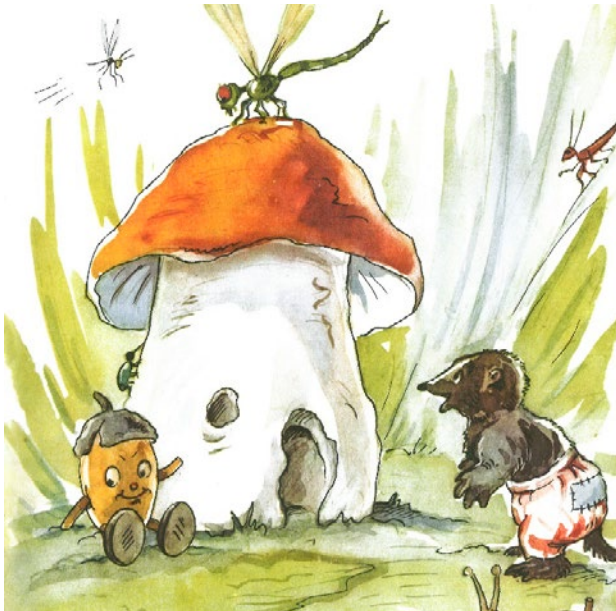
10. attēls. Margarita Stāraste. Zīļuks. Rīga, 1982.

Arī Margarita Stāraste saviem darbiem bija gan teksta, gan ilustrāciju autore. Ar viņas grāmatām izauguši vairāku paaudžu bērni ne tikai Latvijā, bet arī citās valstīs. Guaša un akvareļa tehnikā veidotajās košajās ilustrācijās ar smalki izzīmētām detaļām viņa dzīvē sastopamus dzīvniekus, augus un kukaiņus pārvērš brīnumainas pasaku valstības iemītniekos. Īpaši populāra ir Margaritas Stārastes pasaka par Zīļuku (10. attēls).