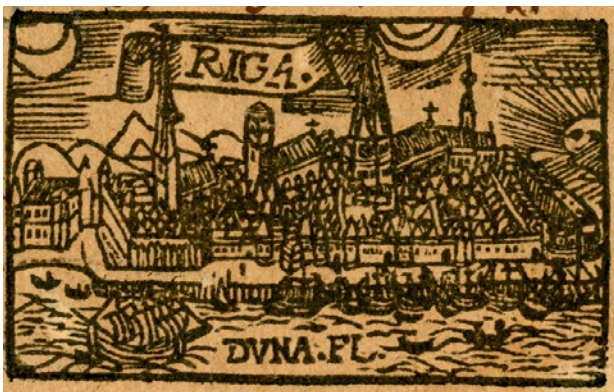
4. attēls. Paul Oderborn. Vier Predigten von dem bogen Gottes in den Wolken . Rīga, 1591.

Aptuveni pirms 600 gadiem grāmatas vairs nerakstīja ar roku, bet sāka iespiest ar presi. Arī ilustrācijas vairs nebija jāzīmē ar roku, tās varēja pavairot ar iespiedpreses palīdzību. Attēlu spoguļrakstā iegravēja cietā materiālā – sākumā tas bija koks, vēlāk arī metāls. To noklāja ar krāsu un pēc tam līdzīgi kā ar zīmogu nospieda uz papīra. Šo tehniku sauc par grafiku . Sagatavošanas darbi grafikai bija ilgi un sarežģīti, toties šādi vienreiz iegravētu ilustrāciju varēja pavairot daudzus eksemplāros.