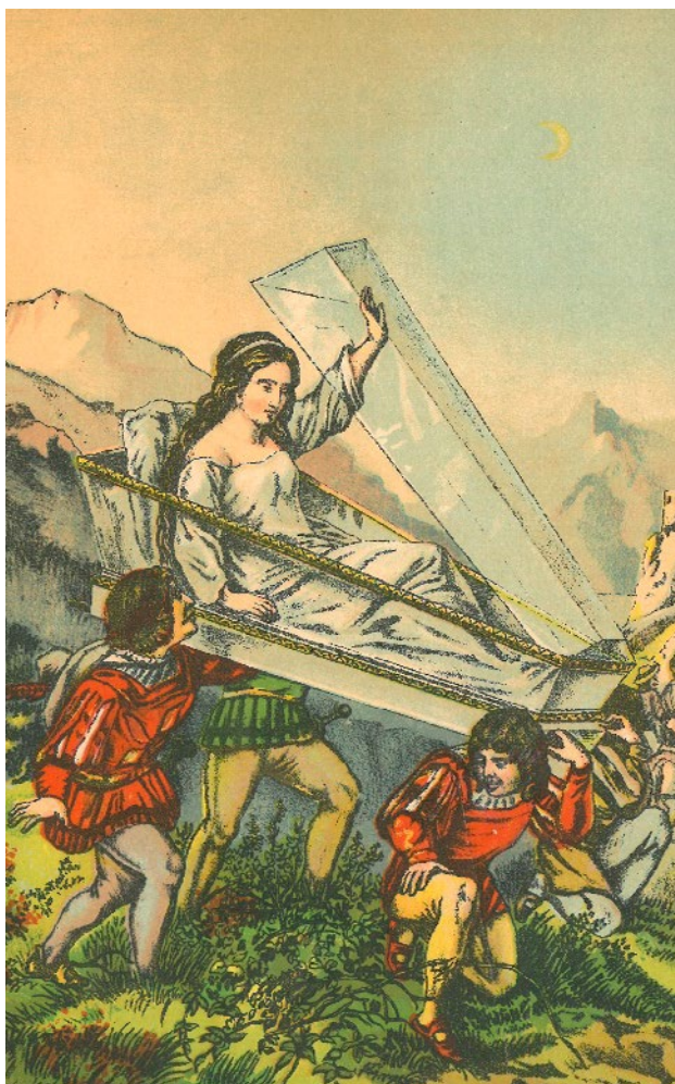
7. attēls. Sniegbaltīte: jauka pasaciņa par derīgu laika kavēkli un pamācīšanu bērnu gados. Jelgava, 1877.